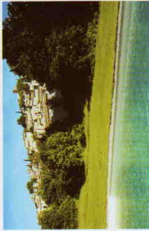
La piscine vue sur Mirmande